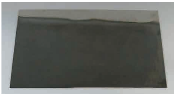
トップファルベBLB Plus ハルセル外観(5A,3分) TOP FARBE BLB Plus Hull-cell appearance(5A,3min)